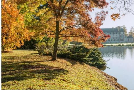
JOURNÉES DES PLANTES DE COURSON octobre 2014