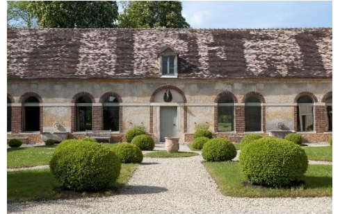
JOURNÉES DES PLANTES DE COURSON été 2021