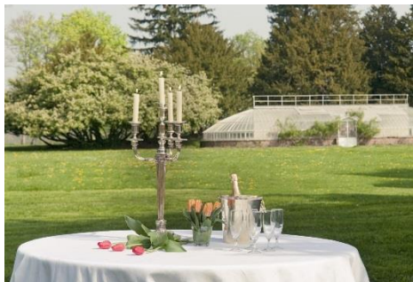
Château de Courson 28/04/2011