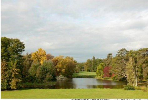
JOURNÉES DES PLANTES DE COURSON octobre 2012