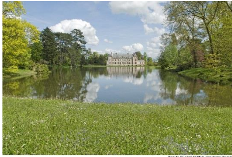
Parc de Courson DCCF