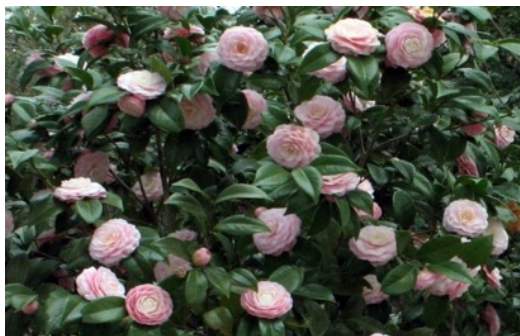
Les camélias fleurissent de mi-février à mi-mars.

Et pourquoi ne pas profiter du Gîte des Camélias à l'occasion de l'une des nombreuses manifestations organisées au Domaine de Courson cette année ? La liste de toutes les dates à retenir sont à découvrir dans « l'agenda 2018 », en dernière page.